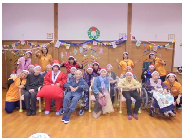
クリスマス会での記念撮影