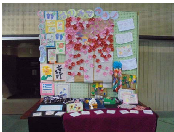
「マキノ生涯学習フェスティバル」に出展した利用者様の作品